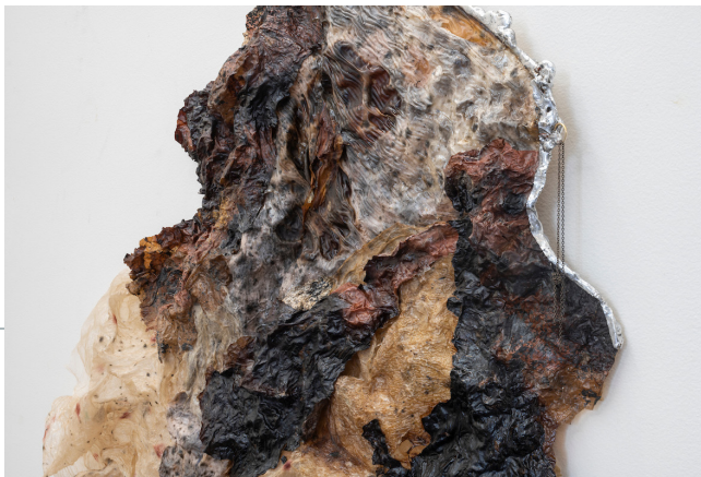
Charlotte Gautier Van Tour, Morceau de faune (détail), agar agar, terre de cassel, étain, 2021, © Martin Argyroglo

partir de cultures symbiotiques qui mêlaient agar-agar, kombucha, spiruline et de multiples sources organiques dont des peaux et des écorces de végétaux.