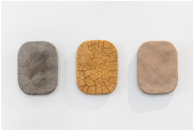
Caroline Le Méhauté, Chaque limite en dissimule une autre , triptyque de portraits de sols, terre crue agricole de l'Essonne, de la Forêt de Meudon et du Jardin des Buttes Chaumont, 2021, © Martin Argyroglo

La terre chez Caroline Le Méhauté est placée dans des états divers, est modelée dans des formes les plus variées, allant de figures géométriques élémentaires aux figures les plus complexes telles que spirales et projections en apparence chaotiques.