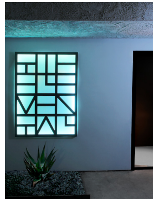
Entrée de The ELEMENTAL, a Contemporary Center for the Arts, Palm Springs