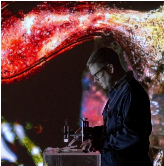
Microscopic video painting with salt, algae, barnacles and fish oil © Brian Champagne

Cristopher Cichoki est diplômé de CalArts, il vit actuellement à Palm Springs en Californie.