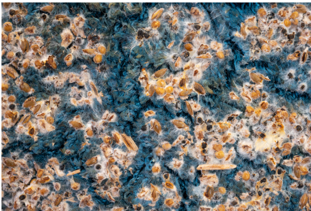
Chloé Jeanne, Le Nez des Champignons ou la Poétique du Mycélium , Moquette et mycélium de pleurotes jaunes (détail), 2021, © Martin Argyroglou

Faire pousser son matériau, pouvoir lui donner forme, être